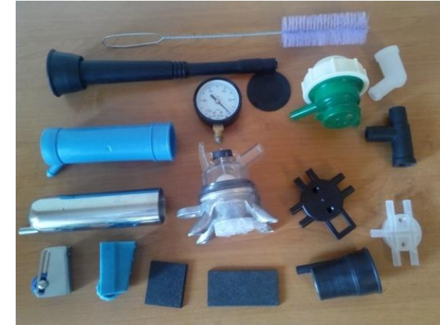
Зношування дійкової гуми